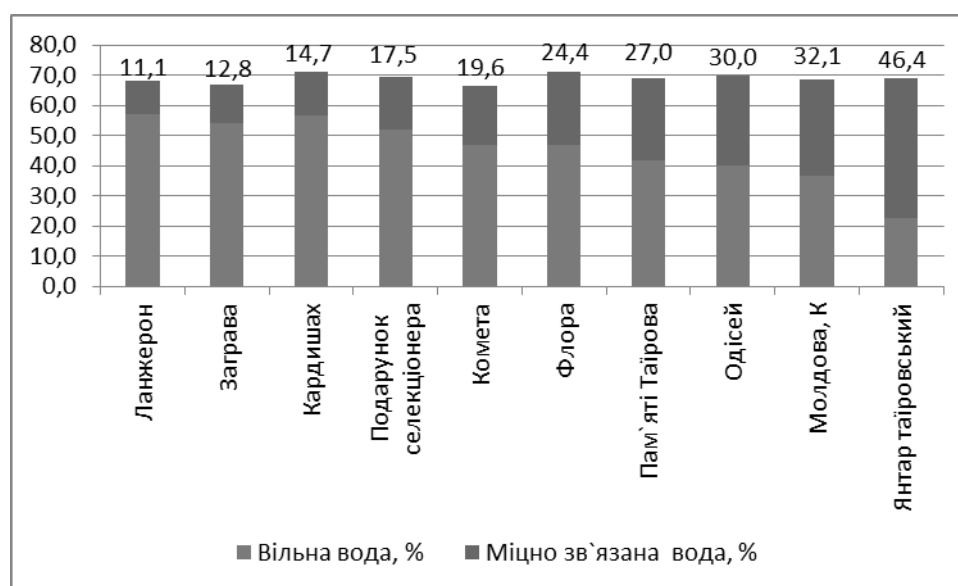
Рис. 1 Вміст вільної та зв'язаної фракції води в листках перспективних столових форм та сортів, 2009 р.

В табл. 3 представлені новітні перспективні генотипи селекції інституту Таїрова, створені на основі кращих інтродукованих та алохтонних сортів за останнє десятиліття. Аналіз їх розрахункової генетичної формули показує перспективність у рівні прояву показників адаптивності, в тому числі й посухостійкості. Підтвердження чи спростування даної гіпотези можливо у ході багаторічних комплексних досліджень даних генотипів, в тому числі й рівня прояву їх стійкості проти посухи.