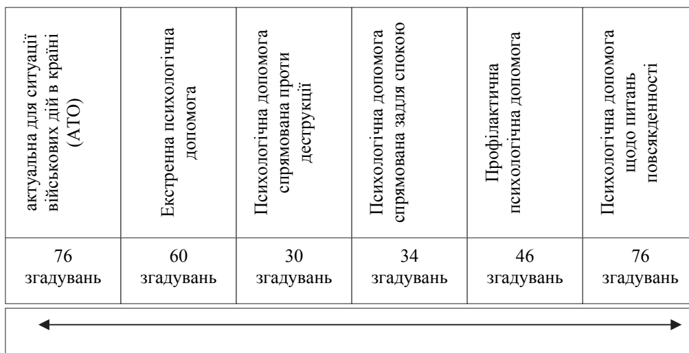
Рис. 1. Частота згадувань щодо потреб суспільства у психологічній допомозі

Аналіз отриманих даних на предмет сприймання майбутніми психологами актуальної ситуації військових дій в Україні більше вказує на ознаки дихотомічності, де психологічна робота як повсякденна не знижує своєї актуальності порівняно з потребою у психологічній допомозі пов'язаній із військовими діями на території України (див. рис. 1).