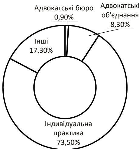
Діаграма 3. Організаційні форми адвокатської діяльності

ської діяльності як адвокатське бюро. Найпопулярнішим воно є в м. Києві.