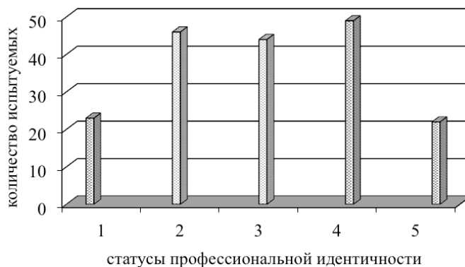
Рис. 1. Распределение испытуемых по статусам профессиональной идентичности 1 — достигнутая идентичность; 2 – псевдоидентичность; 3 – диффузия идентичности; 4 – мораторий; 5 – преждевременная идентичность

присваивается ранг 2, рангу 3 соответствует показатель в группе с псевдоидентичностью, рангу 4 – в группе "мораторий", наконец, рангу 5 соответствует показатель духовного компонента образ Я в группе с преждевременной идентичностью (табл. 2).