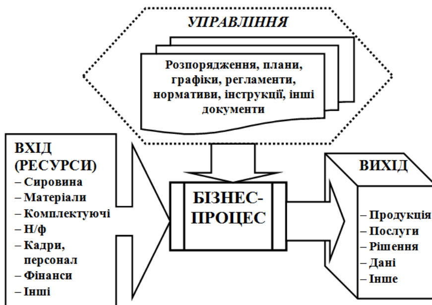
Рис. 1. Узагальнена графічна модель бізнес-процесу підприємства

Результати дослідження. З точки зору кібернетики будь-який бізнес-процес підприємства в найбільш узагальненому виді можна представити у формі так званої моделі «чорної скрині», в якій певним чином входи перетворюються на виходи, як на рис. 1. Входами в цій моделі виступають, зокрема, потоки ресурсів різної природи, а виходами є результати даного бізнес-процесу, тобто продукція, послуги тощо, причому картою бізнес-процесу регламентується і конкретизується перелік та природа його ресурсів (входів), а також визначається специфікація його результатів (виходів).