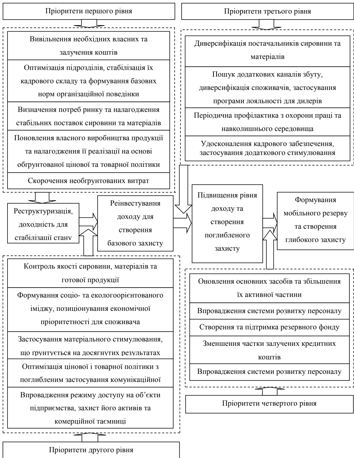
Рис. 1. Формування рівнів економічного захисту підприємства