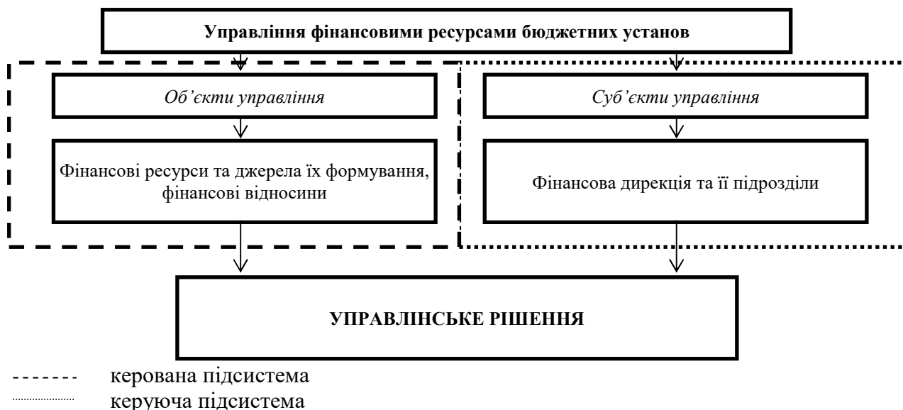
Рис. 2. Управління фінансовими ресурсами бюджетних організацій на засадах системного підходу [власна розробка]

Структуру системи управління фінансовими ресурсами бюджетних організацій наведено на рис. 2.