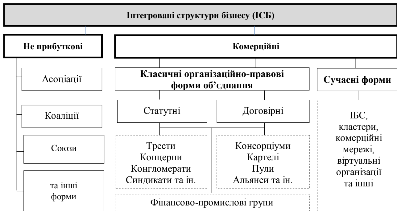
Рис. 3. Узагальнююча класифікація інтегрованих структур бізнесу

Світова практика класифікації ІСБ на сьогодні представляє досить різносторонню понятійну картину. Проведений аналіз наукових доробок у цьому напрямі [4, 6, 7] дає можливість представити узагальнюючу схему детермінації ІСБ (рис. 3).