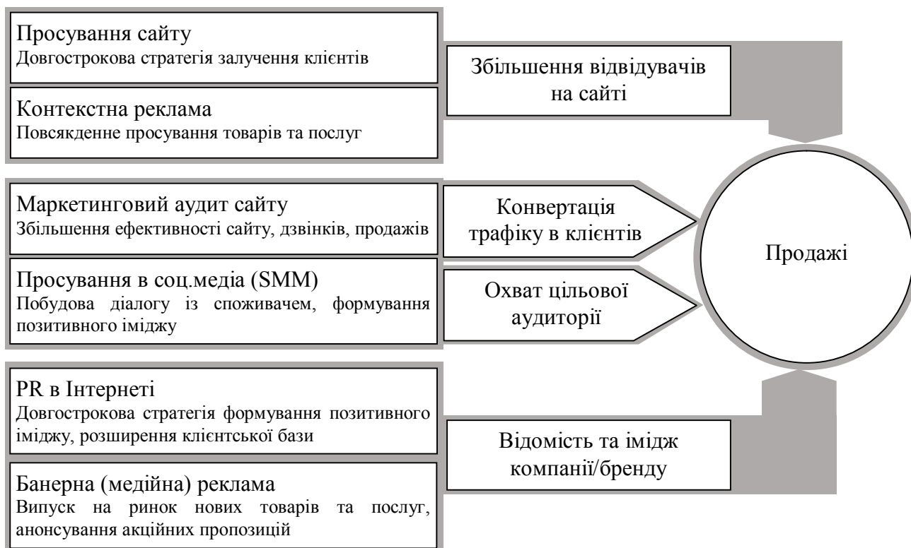
Рис. 1. Формування продажів через мережу Інтернет із застосуванням інструментів Інтернет-маркетингу

На ринку освітніх послуг інструменти інноваційного маркетингу необхідно застосовувати, на сам перед, для залучення абітурієнтів за допомогою новітніх комунікаційних технологій, які дозволяють ширше охопити цільову аудиторію. На сьогоднішній день таким інструментом є Інтернет-маркетинг, який представлений великим різноманіттям методів просування послуг закладів освіти у мережі Інтернет. Кінцева мета застосування методів Інтернет-маркетингу є залучення на сайт ВНЗ відвідувачів, та їх активна участь (регулярне відвідування, реєстрація та в майбутньому перетворення на споживачів освітніх послуг). Стандартна модель формування продажів в мережі Інтернет зображена на рис. 1.