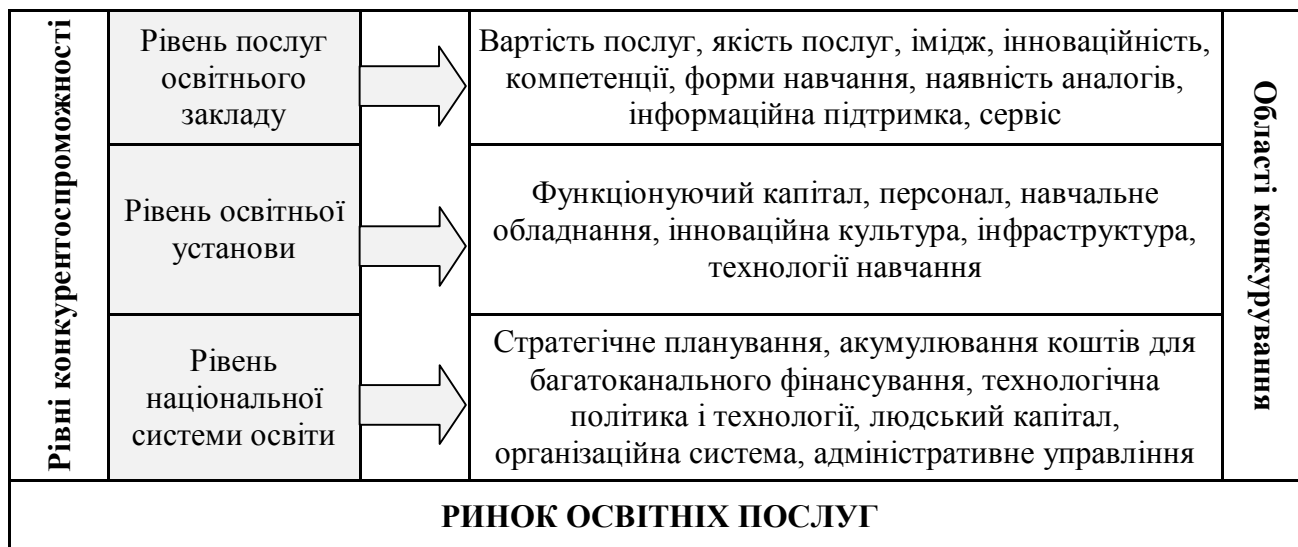
Рис. 2. Схема зв'язків рівнів конкурентоспроможності та областей конкурування на ринку освітніх послуг

Конкурентні переваги національної системи освіти залежать від стратегічного планування, від формування системи акумулювання коштів багатоканального фінансування, технологічної політики і технологій, організаційної системи адміністративного управління.