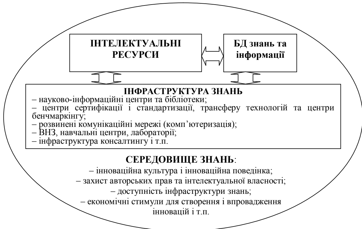
Рис. 1. Структура інтелектуального забезпечення інноваційного розвитку підприємства

На рис. 1 представлена запропонована структура інтелектуального забезпечення інноваційного розвитку підприємництва, яка формується завдяки зусиллям трьох ключових суб'єктів національної інноваційної системи (НІС) – держави, підприємництва та системи освіти і науки.