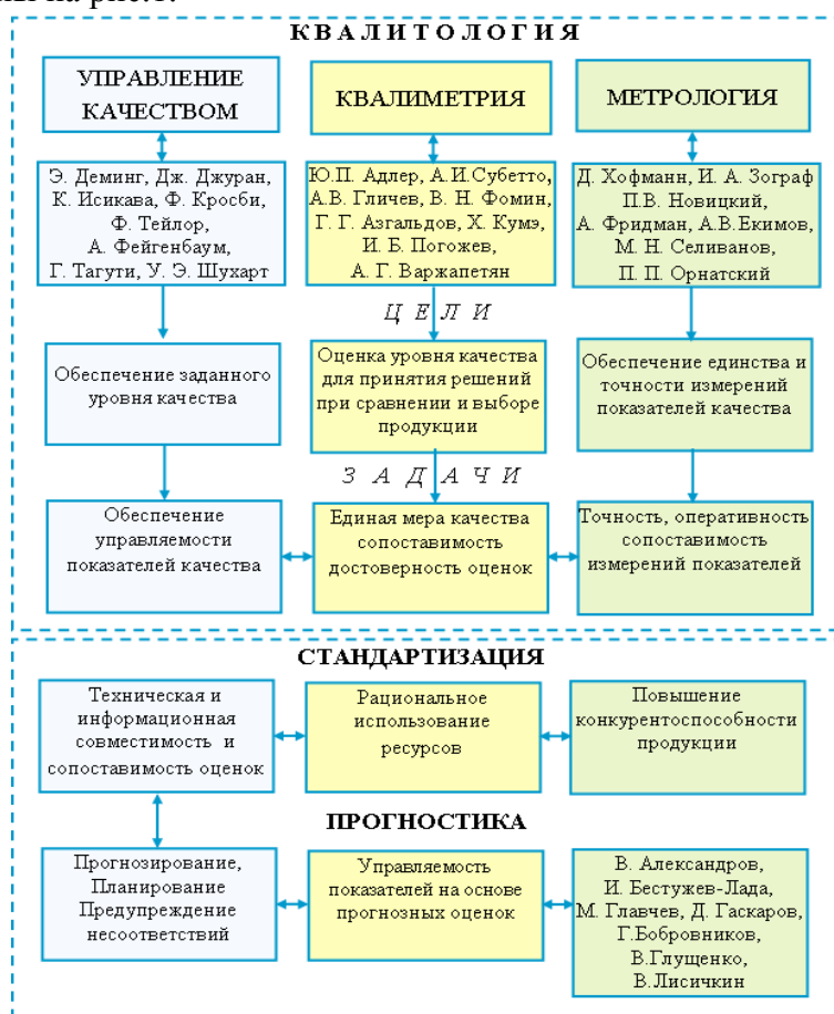
Рис.1. Цели, задачи и научные школы квалитологии, стандартизации и прогностики

В работе [7] показано, что основными методологическими подходами системного исследования качества промышленной продукции являются теоретико-аналитический, эмпирический, эмпирико-теоретический, экспериментально-статистический, эвристический и системно-информационный подходы. При этом, научным инструментарием инжиниринга качества являются методы и средства квалитологии, стандартизации и прогностики. Их цели и задачи, обусловленные требованиями рынка и международных и национальных стандартов серии ISO 9000, а также основатели научных школ представлены на рис. 1.