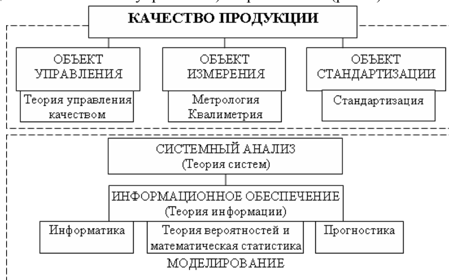
Рис. 2. Методологический аппарат инжиниринга качества продукции

При этом информационное обеспечение инжиниринга качества продукции, основанное на теории информации, включает методы, программные и аппаратные средства информатики, методы теории вероятности, математической статистики (в том числе, методы статистического управления) и прогностики (рис. 2).