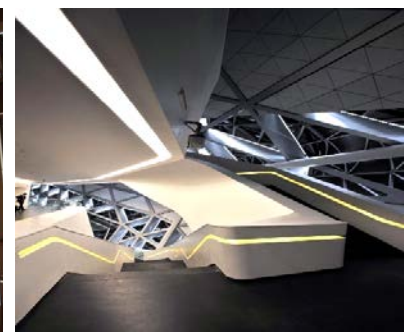
Zaha Hadid. Guangzhou Opera House, Китай. 2010