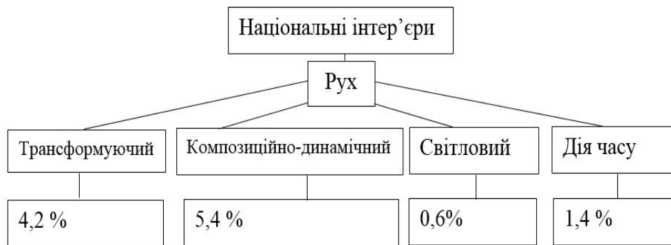
Рис.2. Прояви руху в національних інтер'єрах

Світловий рух відображається в 0,6% через його неоднозначність використання. Він доцільний в офісах, залах розваг.