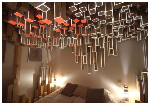
Au Vieux Panier. Архітектурна студія AVExciters, Марсель.2012