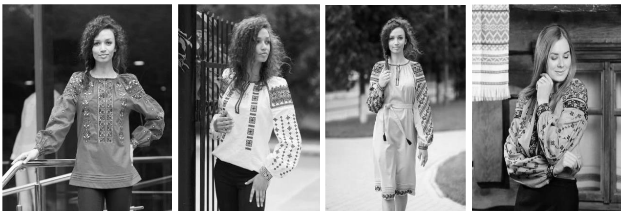
Рис. 1. Сучасні українські вишиванки (машинна вишивка), виготовлені в умовах ПрАТ «Едельвіка»

Гарний вигляд сорочки у процесі експлуатації залежить від якості виконання вишивки та збереження її зовнішнього вигляду на протязі всього періоду експлуатації виробу, який є досить тривалим через високу ціну готового виробу українського виробництва (більше 1 тис. грн. за сорочку та до 5 тис. грн. за сукню вітчизняного виробництва, до 10 тис. грн. за дизайнерську річ) [2].