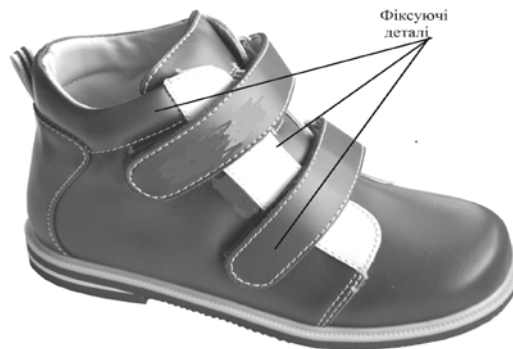
Рис 1. Зовнішній вигляд ортопедичного взуття

оптимальні значення – забезпечувати надійну фіксацію і не вимагати зайвих зусиль при розстібанні. Для забезпечення формостійкості взуття в процесі його експлуатації доцільно, щоб деформаційно-релаксаційні характеристики матеріалів - компаньонів (трипльованих полотен берців і натуральної шкіри клапанів) були близькими.