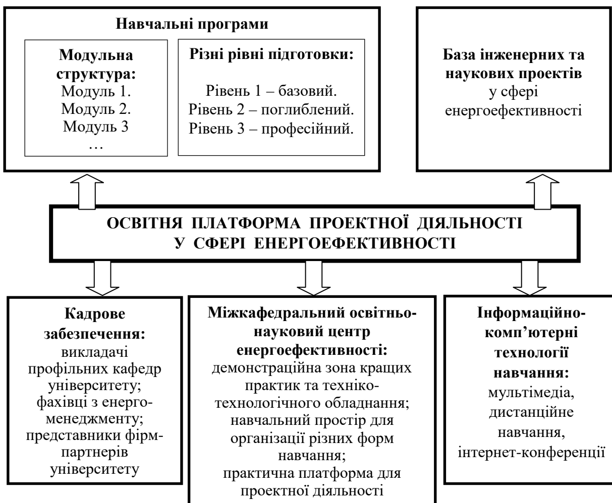
Рис.1. Концепція побудови освітньої платформи проектної діяльності у сфері енергоефективності

Результати дослідження. Для побудови інноваційної освітньої платформи проектної діяльності в сфері енергозбереження та енергоефективності пропонується концепція (рис. 1), яка являє собою систему загальних поглядів, необхідних для цілеспрямованого і оптимального вирішення поставленого завдання [10].