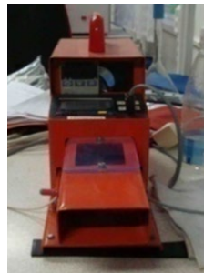
Рис. 2. Прилад PERMETEST

Відносна паропроникність P [%] полотен досліджувалась на приладі «PERMETEST» виробництва Чеської республіки (рис.2).