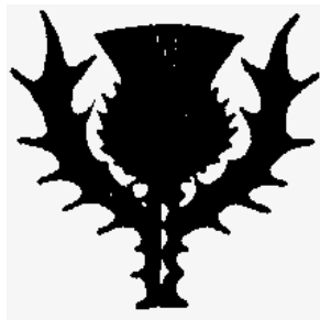
Видавнича марка енциклопедії "Британіка"

Однак "Британіка" ХХІ століття — це не лише традиційне "книжкове" видання, практично незмінне з 1768 року. Корпорація "Енциклопедія Британіка" надзвичайно активно (можливо, навіть активніше від усіх інших відомих енциклопедичних осередків) освоює новітні сучасні технології, починаючи від "Британіки — DVD" (електронного варіанту довідника, що містить понад 100 тисяч статей) до "Британіки — CD" (крім повної версії матеріалів енциклопедії, тут вміщено ще "Словник Вебстера" у скороченому до 160 тисяч слів варіанті) і є визнаним лідером у цій галузі.