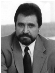
Олександр Афонін, президент Української асоціації видавців та книгорозповсюджувачів