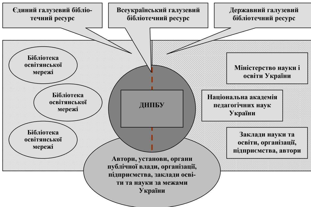
Рис. 2. Концепція формування Всеукраїнського бібліотечного галузевого ресурсу

Пріоритетами інформаційної діяльності науково-педагогічних книгозбірень є науковий, соціальний, культурний та просвітницький напрями. Вдало побудована система інформаційного забезпечення — це важлива умова ефективного функціонування галузевих бібліотек, передумова їхньої здатності швидко реагувати на зміни в суспільстві.