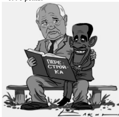
Михайло Горбачов учить гласності Барака Обаму — погляд художника

нього президента СРСР Михайла Горбачова. Серед видань, що побачили світ вже після його відставки, — "Серпневий путч. Причини і наслідки" (1991), "Життя і реформи" (1995), "Роздуми про минуле і майбутнє" (1998), "Зрозуміти перебудову. Чому це важливо нині" (2006), "На самоті з собою. Спогади і роздуми" (2010) та інші. 2008 року Михайло Горбачов репрезентував у Німеччині на Франкфуртському книжковому форумі перші п'ять томів двадцятидвохтомного зібрання творів, куди увійдуть, як планується, усі його публікації 1969 — 1990 років.