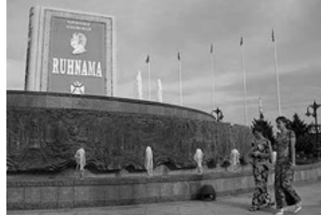
Пам'ятник «Рухнама» у туркменській столиці

мов світу, в тому числі зулуською, видали навіть шрифтом Брайля для читачів з вадами зору. Сукупний наклад книги перевершив мільйон примірників. «Рухнама» встановили пам'ятник, а день завершення роботи над твором — 12 вересня — проголосили державним святом Туркменістану «Днем народження великої книги — Священної Рухнама Великого Сапармурата Туркменбаши». 2006 року «Рухнама» злетіла навіть у космос на борту російської ракети «Дніпро». «Книга, яка завоювала серця мільйонів на Землі, тепер завойовує і космічний простір», — прокоментувала небуденну подію газета «Нейтральний Туркменістан».