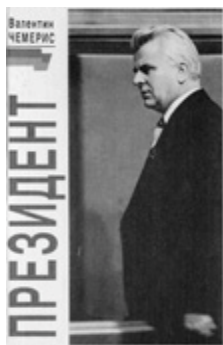
Книга про першого Президента України Леоніда Кравчука

Насправді ж, звичайно, не все так схематично просто. І в політиці, і в книжковій справі. Подивимось на книжкові полиці президентських бібліотек.