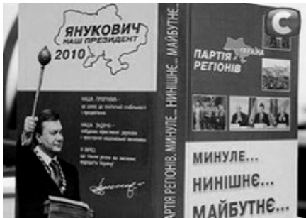
Книга про партію і лідера

Четвертий Президент України Віктор Янукович якийсь час на новому посту теж стримував свої авторські амбіції. Зате писали про нього. У червні 2011 року політичні соратники презентували об'ємну книгу з партійної історії "Партія регіонів. Минуле... Нинішнє... Майбутнє...". Звісно, наріжне місце в ній відведено лідеру політичної сили, його ролі у партійному будівництві і перемогах ПР.