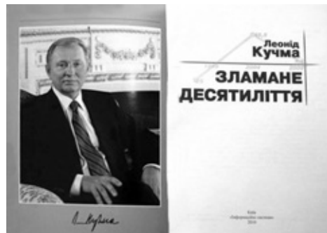
"Зламане десятиліття" Леоніда Кучми

У тому ж таки видавництві "Время" 2007 року вийшла друком і друга книга Леоніда Кучми — "Після Майдану", в якій автор у жанрі щоденника запропонував своє бачення й оцінки політичних подій і політиків України під час і після подій Помаранчевої революції [14]. Це, за словами Леоніда Кучми, була його остання книга, з якою він хотів звернутися до читачів. Проте передумав, і 2010 року вже в Україні вийшло "Зламане десятиліття", книга-роздуми колишнього лідера про політико-економічні проблеми розвитку України, її перспективи [13]. Ця книга також мала неабиякий успіх, була перекладена російською та іншими мовами.