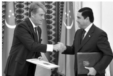
Віктор Ющенко вручає книгу про коней Гурбонгулі Бердимухамедову

Після смерті Сапармурата Ніязова в грудні 2006 року (до слова, в день народження Йосифа Сталіна) його наступник на президентському посту Туркменістану Гурбонгули Бердимухамедов проголосив курс на модернізацію й демократизацію суспільства. Одним із кроків у вказаному напрямі стало вилучення книг попередника з бібліотек та навчальних програм. Проте невдовзі Бердимухамедов і сам взявся за перо та справу просвітництва туркмен. Через рік його правління вийшов з друку перший збірник вибраних промов і окремих цитат президента «До нових висот». Невдовзі побачив світ і двотомник наукової праці «Лікарські рослини Туркменістану», який став, як писали газети, «справжнім подарунком туркменському медикам». 2009 року було видано книжку «Ахалтекінець — наша гордість і слава». Твір президента Туркменістану переклали й українською. Це видання авторові твору передав його колега, Президент України Віктор Ющенко, під час свого офіційного візиту до Туркменістану у вересні 2009 року, підкресливши при цьому, як передала державна служба новин Туркменістану, що книга Бердимухамедова про коней «користується великою популярністю в Україні, ставши ключем до розуміння витоків трепетної любові туркменського народу до неперевершених за красою ахалтекінських скакунів».