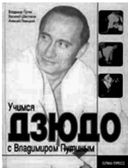
Обкладинка книги Володимира Путіна "Вчітьсь дзюдо"

до влади" Олега Блоцького, "Товариш по службі. Невідомі сторінки життя Президента" Володимира Усольцева, "Путін: вибір Росії" Річарда Саква, "Путін і його ідеологія" Олексія Чадаєва, "Путін і нова Росія" Віктора Тимченка, "Володимир Путін. Полковник, який став капітаном" Олексія Бушкова, "Дипломатія Володимира Путіна. Російське дзюдо на світовому татамі" Сергія Морозова, "Путінська енциклопедія", "Володимир Путін. Рано підбивати підсумки" та інші.