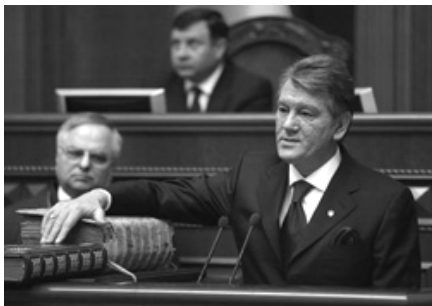
Віктор Ющенко шанував книги

Третій Президент України Віктор Ющенко за час свого правління видав лише одну помітну книгу, зате з промовистою назвою "До нації" [20]. Збірник, куди увійшли понад 140 промов, виголошених упродовж 2005—2010 років, став своєрідним книжково-вербальним підсумком діяльності Віктора Ющенко на посту Президента і вийшов під завісу його каденції на посту очільника держави. Проте, зазначимо, Ющенко, як, певно, ніхто з попередників, цікавився і переймався книжковою справою. Він відвідував видавництва, книжкові виставки і книгарні, надав національного статусу Львівському Форуму видавців, заснував премію "Українська книга року" за вагомі досягнення у сфері літератури та внесок у розвиток українознавства. Зрештою, повідомив Віктор Ющенко, він теж нарешті взявся за перо і наразі пише велику авторську працю про українське питання. Як ми вже зазначали, є видання і про Віктора Ющенко. До згаданих додамо книги Володимира Яворівського "Найдовша ніч Президента", Олеся Вахнія "Чи були ми за Ющенка вільними", Жерара де Вільє "Убити Ющенка!", Сергія Руденка "Вся президентська рать. Оточення Віктора Ющенка від "А" до "Я".