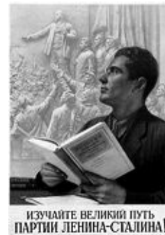
Рівняння на Леніна-Сталіна з "Коротким курсом"

Ідеологічну функцію пропаганди і утвердження партійної концепції історичного розвитку виконував і "Короткий курс історії ВКП(б)", створений у СРСР під керівництвом Йосипа Сталіна [2]. Упродовж багатьох років цей підручник був основою формування марксистсько-ленінського світогляду радянських людей. З 1938 по 1953 рік "Короткий курс" видали 301 раз накладом 42 816 тисяч примірників на 67 мовах. Після смерті Сталіна створили клон видання, який відтоді називався "Короткий курс історії КПРС", однак продовжував бути наріжним у комуністичному вихованні.