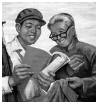
Книгу Мао мав вивчати кожен

Окрім пропагандистських завдань, обґрунтування того чи іншого державного устрою й способу здійснення влади книги часто використовують, як уже зазначалось, і для творення культу особи політичного лідера, вождя держави. Найхарактерніше це для тоталітарних, авторитарних режимів. Прикладом такого видання є "Цитатник" Мао Цзедуня, лідера КНР. З'явився він після китайської "культурної революції", під час якої масово знищували політичних опонентів та "шкідливі" твори. "Цитатник" увібрав майже 500 ніби особистих висловлювань Мао, знання і цитування яких стало обов'язковим для китайців. "Маленька червона книжечка" (так іще називали "Цитатник"), завдяки у тому числі одіозності та їй, не відкинемо, оригінальному формату видання, стала однією з найпопулярніших у світі, сукупний наклад "Цитатника" уже досяг майже мільярда примірників (більше видавали лише "Біблію") [10]. Користується видання попитом і досі, є брендовим сувеніром для туристів, які відвідують Китай.