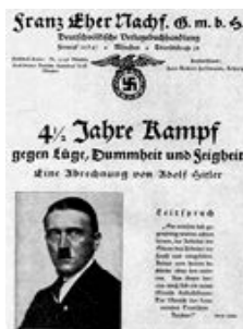
Рекламна листівка Франца Ехера Ферлага видання "Майн Кампф"

Книга мала величезний успіх. Уже до 1932 року продани понад п'ять мільйонів примірників твору, його перекладали на одинадцять мов. Обмеженим накладом "Мою боротьбу" було видано і для вищого партійного керівництва СРСР. Надзвичайно популярною стала книга в Америці. Там реалізували понад 500 тисяч примірників видання. Зважаючи на такий комерційний успіх, Гітлер подав навіть позов до суду про порушення американцями його авторських прав і виграв справу.