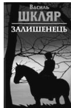
Василь Шкляр. "Залишенець"

Утім, особливого резонансу, забарвленого в ідеологічні фарби, набули в Україні дві книги. Перша — "Вирвані сторінки з автобіографії" лауреатки Шевченківської премії Марії Матіос, яка побачила світ у львівському видавництві "Піраміда" і була, до слова, визнана кращою книгою 2010 року [6]. Депутат-комуніст Петро Цибенко звернувся із запитом до Генпрокуратури, у якому стверджував, що письменниця допустила образливі слова щодо пам'ятника радянським воїнам і зажадав припинити розповсюдження твору. До видавництва навідалися працівники міліції, щоб, ніби за дорученням ГПУ, вилучити книгу з продажу. Інші міліціонери прийшли до Матіос вже в Києві, де розпитували про письменницю сусідів. Лауреатка звернулася до генпрокуратури В. Пшонки з відкритим листом про політичні переслідування і зажадала пояснень. Той вимушений був виправдовуватись, що не давав жодних доручень щодо утисків письменниці. А наведені факти ледве не самодіяльність міліціонерів. Міністр МВС А. Могильов у свою чергу лише розвів руками: як же без вказівки?! Слово за слово, і зчинився скандал, де гасу у вогонь додавали політики, які вбачали у протистоянні саме ідеологічні причини. Із письменницею для з'ясування обставин конфлікту зустрівся навіть Президент України Віктор Янукович, після чого справу залагодили.