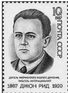
Марка пошти СРСР на честь 100-річчя журналіста-інтернаціоналіста

організаторів комуністичної партії США, очолив партійну газету "Голос праці", його обрали членом Виконкому Комінтерну, він неодноразово зустрічався з Леніним. 1920 року Джон Рід прибув до Росії для участі в роботі II комінтернівського конгресу, а потім вирушив по країні збирати матеріали для нової книги. Дорогою захворів ніби на тиф (за іншою версією його отруїли) і помер. Поховали Джона Ріда (єдиного з американців) у некрополі видатних комуністичних діячів біля Кремлівської стіни у Москві. На честь журналіста назвали вулиці у Санкт-Петербурзі, Астрахані, Серпухові та інших російських містах, його книгу неодноразово екранізували. 1927 року це зробив Сергій Ейзенштейн (фільм називався "Жовтень"), а пізніше твір став основою кіноопеї Сергія Бондарчука "Червоні дзвони".