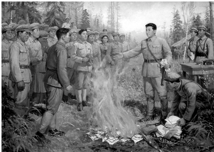
Товариш Кім Ір Сен спалює видання матеріалів XX з'їзду КПРС

Справу батька продовжив і Кім Чен Ір, який став наступним президентом КНДР. Окрім теоретичних праць про філософію чучхе, соціалізм як науку, розбудову партії, він багато писав і про чучхейську літературу, образотворче, танцювальне, драматичне мистецтво, підготовку для армії жіночих керівних кадрів, подальший розвиток народної освіти, деякі питання виховання дітей і навіть про Кімїрсенхву — "квітку безсмертя, що розквітає у серцях людей епохи самостійності"... Ці праці також обов'язкові для вивчення на політзаняттях корейського народу. Можливо, поповнять книжкові надбання родини північнокорейських лідерів і праці наймолодшого сина Кім Чен Іра Кім Чен Іна, який очолив країну після смерті батька у грудні 2011 року. А поки новий правитель заклопотаний іншими державними справами, книгу спогадів "Мій батько Кім Чен Ір і Я" у спів-авторстві з японським журналістом Йодзі Гомі видав старший син колишнього корейського правителя Кім Чен Нам. Свого часу він зазнав батькової немилості за те, що намагався відвідати Японію за підробленим паспортом, і нині проживає в Китаї. Книга є зібранням електронного листування та інтерв'ю Кім Чен Нама з журналістом. Серед іншого фактичний вигнанець з Північної Кореї прогнозує майбутній неминучий, на його погляд, крах спадкоємного політичного режиму КНДР.