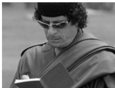
Муаммар Каддафі і його "Зелена книга"

Уперше і востаннє в Радянському Союзі твір Каддафі видали в часи перебування перед розпадом СРСР 1989 року [3].