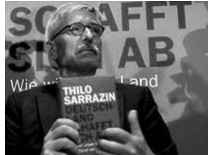
Тіло Саррацин — знамення краху мультикультурної епохи

но. На думку німецьких аналітиків, якби політик і справді вирішив створити свою партію, це могло б суттєво вплинути на розподіл політичних сил в країні. Поки що ж популярністю Саррацина вирішила скористатись Націонал-демократична партія Німеччини. У своїй передвиборчій агітації вона використала зображення обкладинки книги "Німеччина — самоліквідація", супроводивши його надписом "Саррацин — правий!". Це стало приводом для судового розгляду. Видавництво "Рандорф Хаус" зажадало заборонити НДПН використовувати книгу "Німеччина — самоліквідація" у передвиборчій боротьбі. 2011 року суд наклав таку заборону.