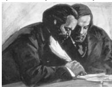
Карл Маркс і Фрідріх Енгельс за роботою. Картина невідомого

Книги неодноразово ставали (є й донині) засобом пропаганди політичних ідей, а зрештою, і здобуття та здійснення влади. Класикою "жанру" є, поза сумнівом, "Маніфест Комуністичної партії" Карла Маркса та Фрідріха Енгельса, що вперше побачив світ 1848 року і відтоді багаторазово перевидавався. Уперше російською "Маніфест" видали на початку 60-х років XIX століття у перекладі Михайла Бакуніна у друкарні "Колокола". Він мав величезний вплив на суспільні настрої, ставши своєрідним посібником для тих, хто прагнув змінити світ відповідно до комуністичних ідей. Програмний твір обґрунтував мету, завдання і методи боротьби комуністичних організацій та партій за владу [5].