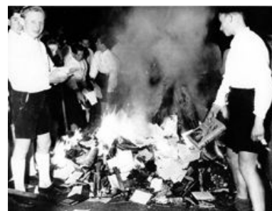
Спалення книг у нацистській Німеччині