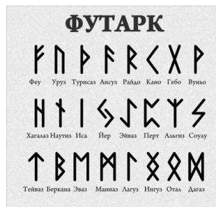
Рис. 4. Фугарк

фавіту: f, u, t, a, r, k. Зазвичай цим словом позначаються будь-які рунічні алфавіти, незалежно від народу, який використовував ту або іншу модифікацію [11].