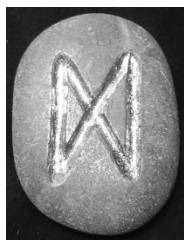
Рис. 3. Руна Дагаз

Отже, сформулюємо робоче визначення для нашого дослідження: символічна комунікація — вид соціальної комунікації, в якій передавання смислів здійснюється архетиповими образами. Прикладом їхнього шифрування в символах є рунні символи, в яких не тільки закодована статична інформація, а й представлені динамічні процеси розвитку комунікативної ситуації. Наприклад, розглянемо символічне значення руни Дагаз, загальновідомої як знак нескінченності (рис. 3).