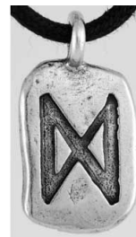
Рис. 5. Амулет — руна Дагаз

Символьне значення руни Дагаз — прорив, день, трансформація, завершення, ініціація, перехід. Один рішучий крок — і ви вже в іншому світі. Це значні зміни або прорив у процесі зміни себе, повна трансформація у відносинах, поворот на 180 градусів, зміна життєвих орієнтирів, відкриття нових перспектив [11]. Використання руни Дагаз в амулетах (рис. 5): а) допомагає лікуванню затяжних або хронічних захворювань, починає етап одужання; б) допомагає змінити ваші власні погляди і стереотипи поведінки; в) готує "прорив" у будь-якій галузі, щоб зрушити справу з "мертвої точки"; г) допомагає досягти психологічну стабільність і внутрішню гармонію.