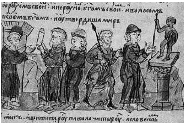
Рис. 2. Клятва воїнів Олега зброєю і богом.

У контексті дослідження так зване городище можна вважати капищем. Вбачати, що саме тут відбувався зв'язок із вищими силами, небесним захисником в особі бога Тора. Головний оборонець людства змагався і бився з предковічними силами безладу молотом із куцою ручкою Мйольніром. Зброєю далекого бою особливав закон. Цілив ним у супротивника без промаху. Описавши замашну криву, молот повертався до власника. Бог був суворим, жорстоким, вимагав послуху й підкорення. І його покарання було відповідним: порушник ставав злочинцем і вигнанцем зі "світу людей", якого можна було безкарно вбити, наче лютого звіра. Володар блискавки, грому, покровитель воїнів оберегав дружину на війні. Клятву воїнів Олега зброєю і богом зображено на рис. 2 [28, с. 199].