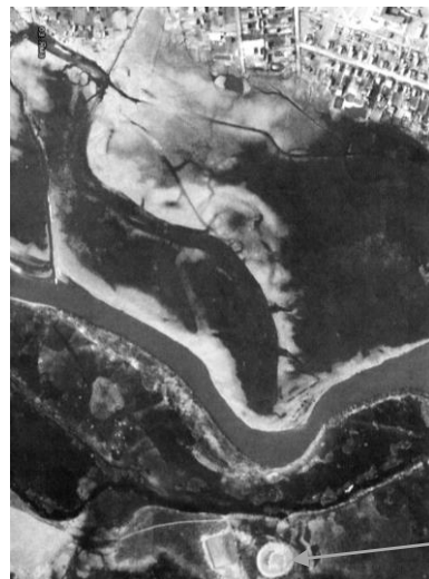
Городище (пам'ятка історії X століття національного значення)

Повніше з'ясувати цей аспект допоможуть відомості про легендарного Рюрика (Хрерікера). Був хрещений, прийшов на землі, які у 862 році отримали назву Київської Русі. У попередніх походах на Францію, Іспанію завжди діяв спільно з норвежцями, у війську також були ободріти, руяни. Показово, що землі Східнослов'янської рівнини утворювали по ріках Мсті і Лузі природний кордон з Норвегією, тому, безсумнівно, можемо спиратися на історичні факти від перших державних службовців зі Скандинавії.