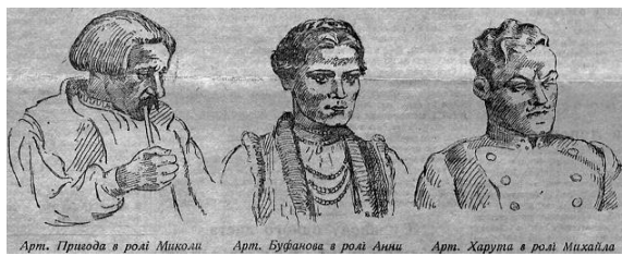
Фото 5. Актори Дрогобицького обласного театру в н'єсі Івана Франка "Украдене щастя". Підпис "Б. Ш." на тлі середньої постаті. — "Більшовицька правда". — 1941. — № 61. — С. 3.