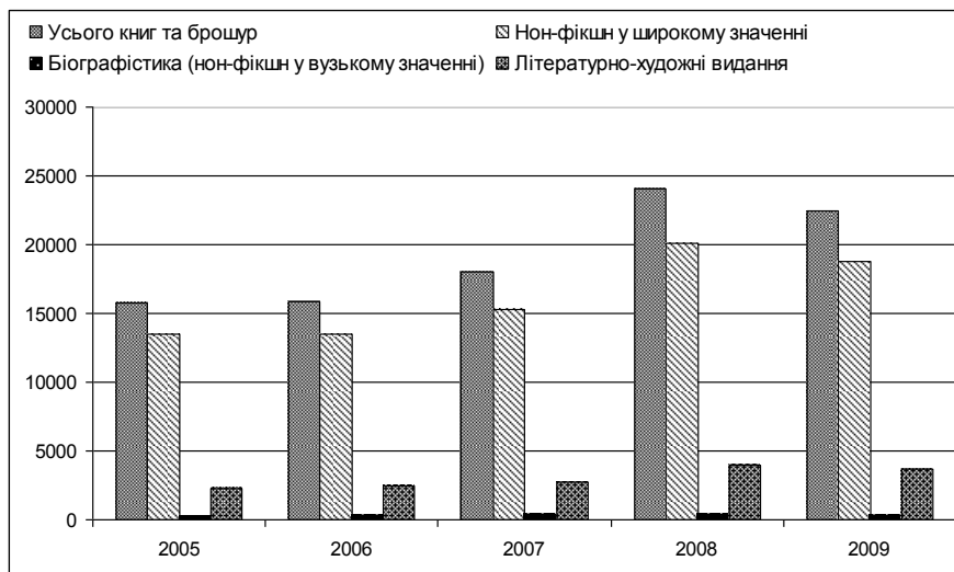
Діагр. 1. Кількість нон-фікшн та літературно-художніх книг, виданих у 2005—2009 рр., друк. од.

Досліджуючи сегмент біографічних видань нон-фікшн у загальній структурі видавничого ринку того часу, порівняймо кількість виданих у 2005—2009 рр. літературно-художніх та нон-фікшн книг (діагр. 1). Як свідчать статистичні дані Книжкової палати України, кількість літературно-художніх видань 2008 р. зросла на 75%, порівняно із 2005. Однак загальне співвідношення літератури нон-фікшн у широкому значенні до художньої протягом досліджуваного періоду становило 5:1. Якщо відокремлювати частку саме біографістики, то 2005 р. вона становила 1,2% загальної кількості видань нон-фікшн, а 2007 — вже 2,7 % нон-фікшн у широкому значенні.