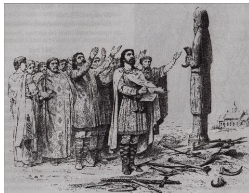
Рис. 3. Князь Ігор перед скульптурним зображенням божества

Біля стовпчастого зображення "княжого бога", вирізьбленого з дерева, надавалася присяга на вірність вождю (рис. 3).