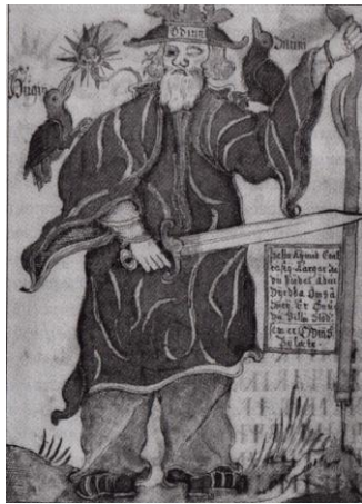
Рис. 1. Скандинавське божество Одін. Малюнок XVIII ст.

У численних походах військові скандинави-мандрівники втрачали взаємини з багатьма божествами, які поза межами батьківщини сили не мали [9, с. 175]. За винятком двох: головного в небесному пантеоні Одіна (рис. 1), господаря війн і військового раю Вальгалли, та його старшого сина Тора.