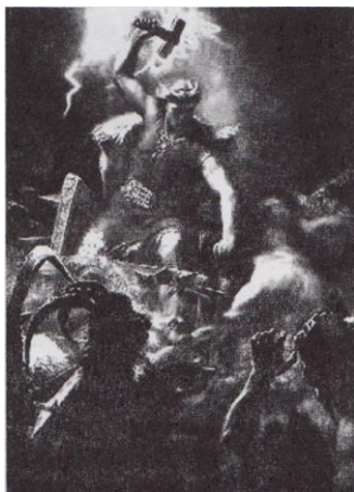
Рис. 2. Тор разить ворогів чарівним молотом

Де б не було військо, його супроводжував повсюдний Тор (рис. 2), старший син Одіна.