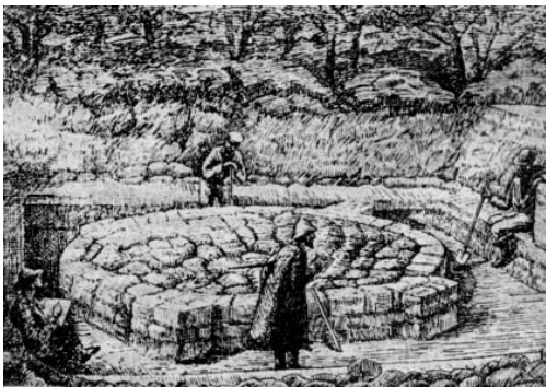
Рис. 5. Капище для приношення жертв у Києві

Свята "управителька землі" розширила межі княжого панування, заснувавши осередки місцевої влади. В них впроваджували "дани", "уроки", "оброки", слідували за виконанням законів, вирішували важливі справи, правували: "Судні і жертвні місця були одні й ті самі, богослужіння тісно були пов'язані із судочинством і супроводжувалися видовищними обрядами, викликали сильні враження та почуття" (рис. 5)