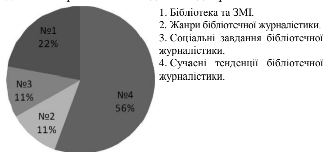
Діагр. 1. Розподіл відповідей студентів щодо модулів курсу "Бібліотечна журналістика"

Після опанування курсу "Бібліотечна журналістика" студенти беруть участь в анкетуванні, що допомагає зрозуміти їхні потреби й доцільність навчальної програми. Відповіді на основне запитання "Який модуль курсу "Бібліотечна журналістика" був для Вас корисним?" наведено на діагр. 1.