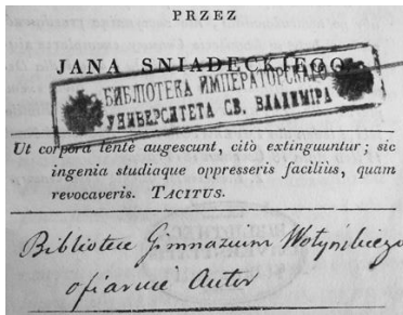
Фото 1. Автограф Я. Снядецького на книзі: Sniadecki J. Żwot literacki Hugona Kollatja z opisaniem Stanu Akademii Krakowskiej, w jakim się znajdowała przed rokiem Reformy 1789 / J. Sniadecki. — W Wienie Nakładem i Drukiem Józefa Zawadzkiego Typografa Uniwersytetu, 1714. — 144 s.

Цей факт підтверджує печатка на титульному аркуші: "Библиотека Императорского Университета Св. Владимира", "Bibliotheca universitatis St. Vladimiri". У нижній частині титульного аркуша розміщено дарчий напис автора для бібліотеки Волинської (Кременецької) гімназії, зроблений чорними чорнилами: "Bibliotecz Gimnazium Wolynskiego ofiaruie Autor". Книга має м'яку рожеву оправу, якій бракує першої частини. На титульному аркуші зверху наведено шифр "Крем 2246". На другій частині оправи зверху розміщено білу чотирикутну наліпку з написом "Сг 2246". Аркуші книги пошкоджені.