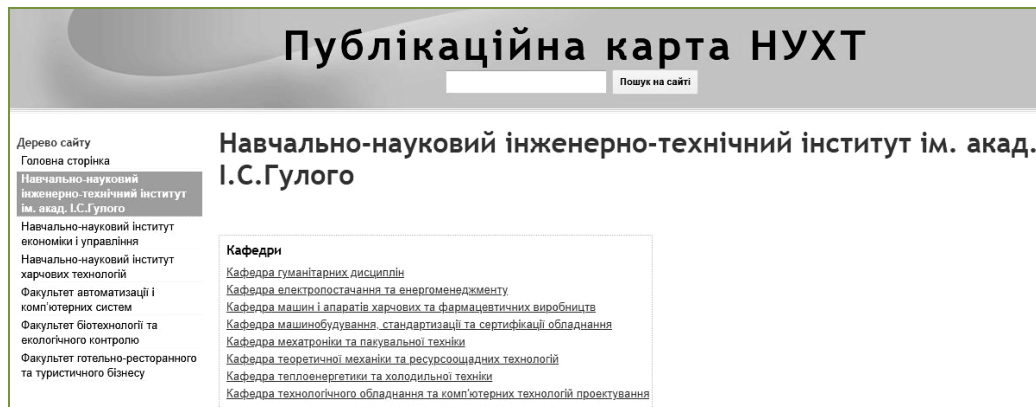
Рис. 1. Головна сторінка інформаційно-аналітичної системи "Публікаційна карта НУХТ"

— надання доступу до ресурсів у відкритих джерелах.