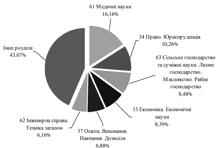
Діагр. 3. Відсотковий розподіл публікацій за розділами УДК

Висновки. Результати бібліометричного аналізу кількості публікацій у базі даних "Літопис журнальних статей" за 2018 р. за розділами УДК доводять, що пріоритетним напрямом досліджень в Україні є медичні науки та суспільствознавство, а