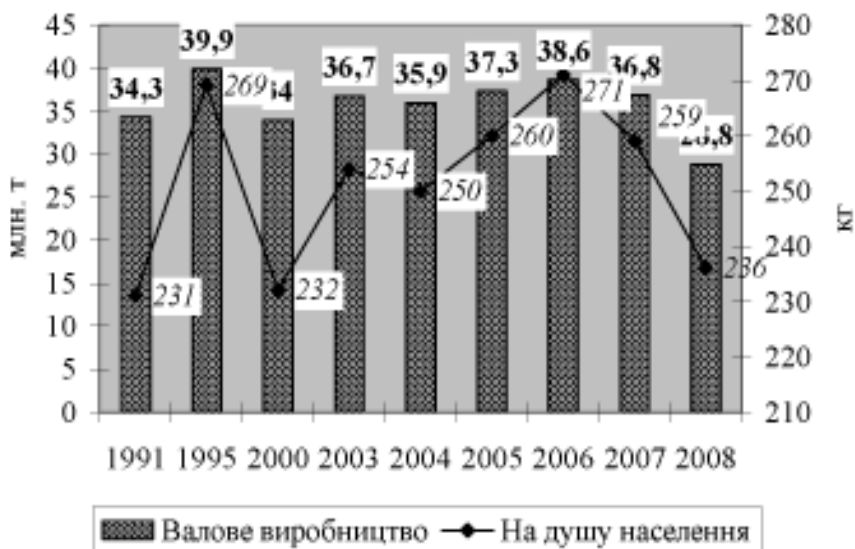
Рис. 2. Динаміка валового збору картоплі в Росії

*Побудовано на основі даних міністерства сільського господарства Російської Федерації