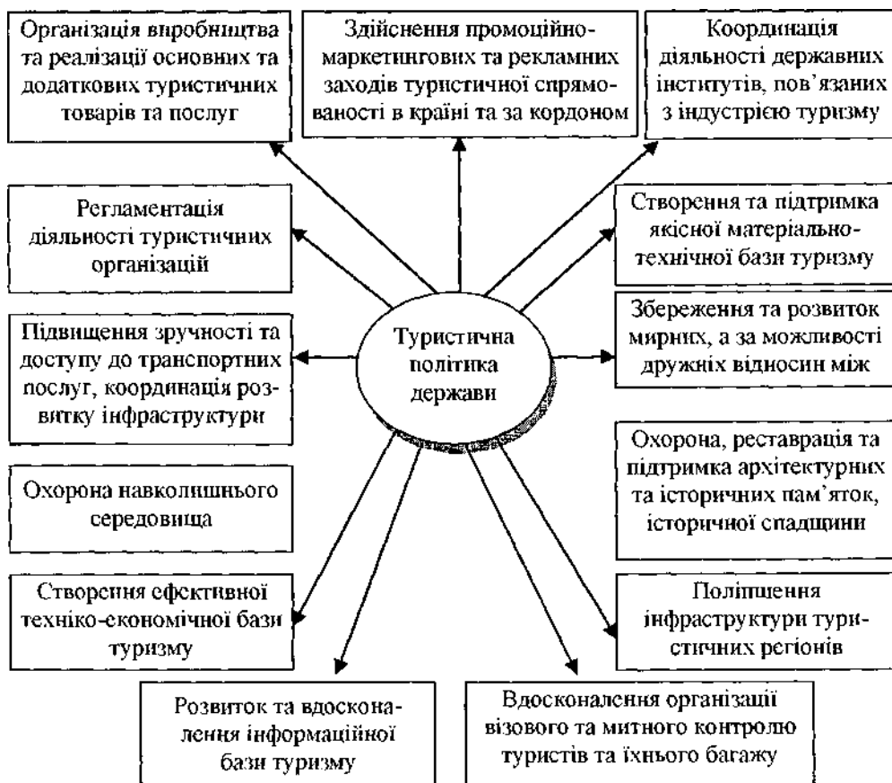
Рис. 1. Вплив туристичної політики держави на сфери суспільних інтересів (авторська розробка)

приклади таких розвинутих туристичних країн, як Туреччина та Єгипет, які щорічно тільки на рекламу своїх туристичних атракцій за кордоном (у т.ч. в Україні) витрачають сотні тисяч доларів США [1, 16]. Важливе місце серед рекламних носіїв при популяризації туристичних можливостей країни за кордоном відіграють міжнародні телеканали – такі, як Euronews, BBC World, CNN, National Geographic та інші. Різні країни світу активно використовують можливості прорекламувати свої туристичні принади на цих телеканалах, оскільки їхня аудиторія складає декілька мільярдів на всіх континентах за виключенням Антарктиди. Така реклама здійснюється шляхом підготовки та демонстрування на телеканалах рекламного ролику тривалістю пів-хвилини–хвилину, який окрім показу цікавих туристичних об'єктів країни містить також рекламне звернення (слоган) (табл. 1).