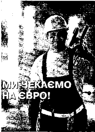
Рис. 3. Рекламний плакат «Ми чекаємо на ЄВРО»

міста України – хазяєва ЄВРО–2012 стали декораціями для серії роликів «High time to see Ukraine». В гонитві за дивом знімальна група піднімалася високо в гори, куди техніку могли завести лише потужні вантажівки «Урал». Режисер змушував у листопаді звозити сіно на вже прибрані поля. Складним завданням виявилось змусити овець, що пасуться на Карпатських полонинах, хоча б підняти голови, але допоміг випадок. Якось одна овечка зачешілася за кабель освітлювального пристрою. Накидавши на знімальний майданчик багато кабелів, творча група досягла неможливого – в кадрі вівці з баранами скачуть, немов дресировані. Результат цієї роботи з 1 грудня 2011 з'явився на семи міжнародних телеканалах – CNN, BBC World, Euronews, National Geographic, Fox, Sky News та Sky Sports, телеаудиторія яких охоплює понад 2,5 млрд. мешканців Землі на всіх континентах окрім Антарктиди. Це безпрецедентна за масштабом та кошторисом для України промокомпанія.