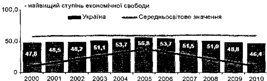
Рис. 1. Динаміка індексу економічної свободи України

Індекс сприйняття корупції віддзеркалює сприйняття представниками ділових кіл країн світу корумпованої, яке має місце у державному секторі, та оцінюється за шкалою від 10 (корупція практично відсутня) до 0 (значний рівень корупції).