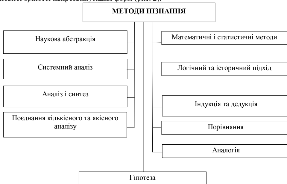
Рис. 2. Основні методи пізнання в економічних дослідженнях*

Історичний елемент діалектичного методу пізнання передбачає дослідження конкретного процесу розвитку, реальних явищ в їх історичній послідовності, а логічний – спосіб пізнання економічної системи, окремих її елементів у період досягнення повної зрілості найрозвинутіших форм (рис. 2).