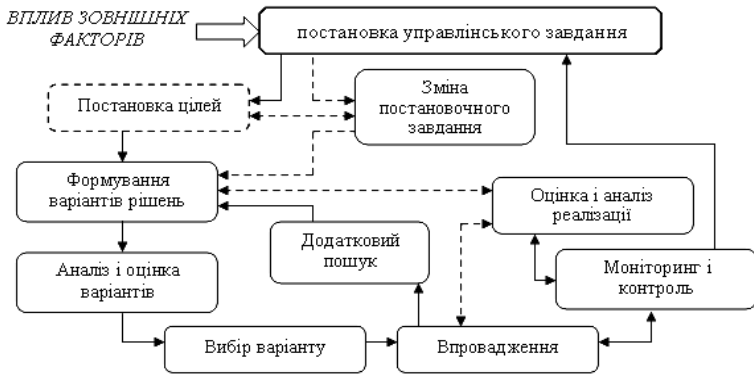
Рис. 2. Схема процесу управлінських рішень

Як стадія циклу управління, перелік функцій управління не залежить від типу і виду діяльності та є однаковим у всіх економічних системах, у той же час перелік функцій діяльності, як частини циклу господарської діяльності, у різних економічних системах може суттєво відрізнитися.