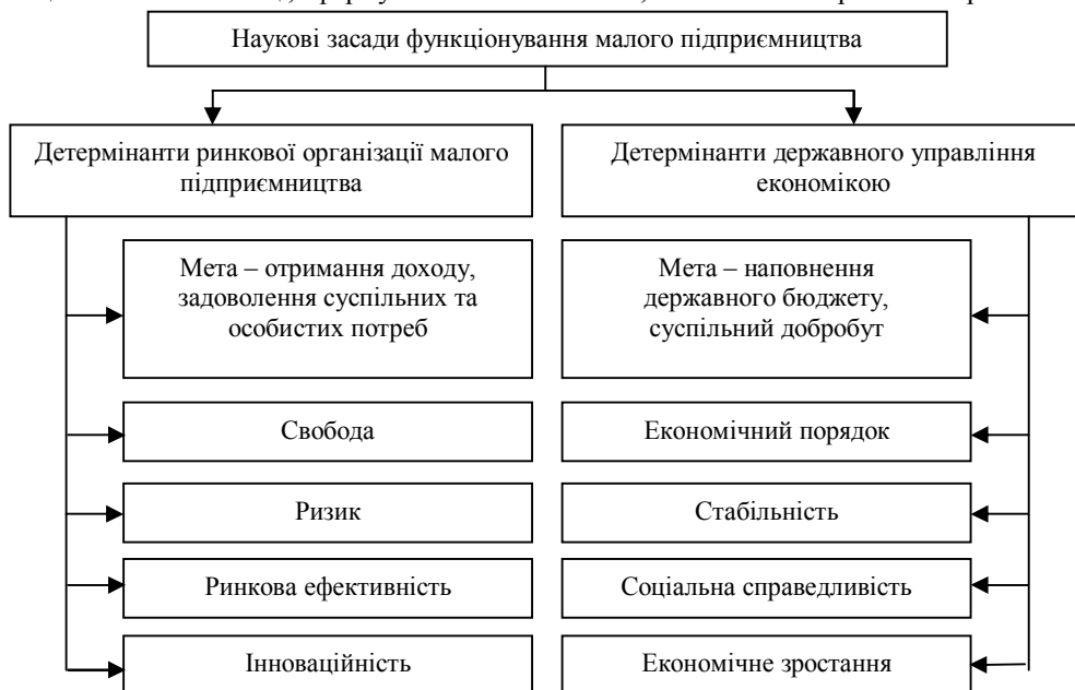
Рис. 1. Наукові засади успішного функціонування малого підприємництва.

Функціонування малого підприємництва визначає принципи взаємодії держави і ринку на мікрорівні. Наукові засади успішного функціонування малого підприємництва в національній економіці, сформульовані І. Власенком, схематично зображено на рис. 1.