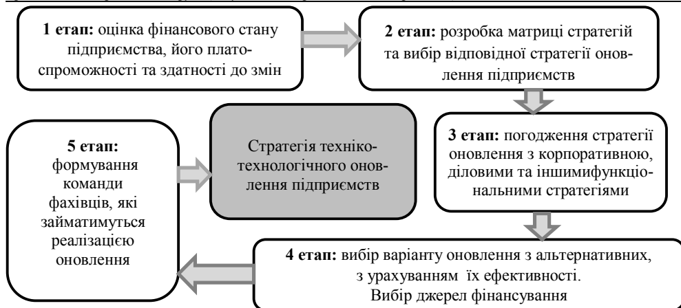
Рис. 2. Етапи розробки стратегії техніко-технологічного оновлення

Стратегія техніко-технологічного оновлення пов'язана із загальною стратегією підприємства та призводить до змін на інших рівнях стратегії; сприяє вдосконаленню організації бізнесу та підвищує ефективність діяльності підприємства. Процеси оновлення та впровадження відповідної стратегії потребують, в першу чергу, фінансової оптимізації та, за необхідності, організаційних перетворень. З оптимізацією організаційної структури пов'язана стратегія організаційних змін, яка має бути адаптована до стратегії оновлення шляхом впровадження відповідних підрозділів та спеціалістів у структуру управління підприємства.