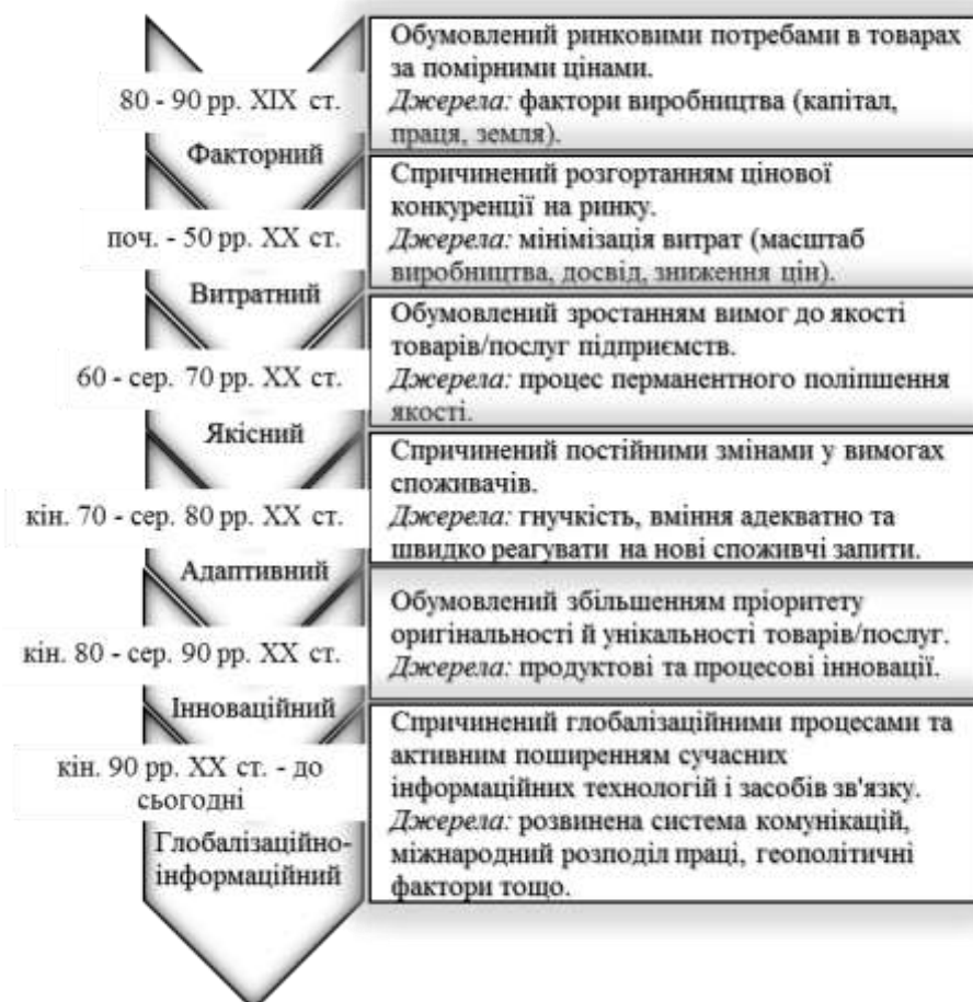
Рис. 2. Етапи джерел формування конкурентних переваг

Адже, як стверджує А. О. Сітковська «в умовах розвинених ринкових відносин конкуренція спонукає до пошуку нових, більш досконалих організаційних форм бізнесу, до розробки і впровадження досягнень науково-технічного прогресу» [5, с. 39]