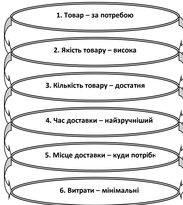
Рис. 3. Шість правил логістичного управління

При цьому, управління логістичними процесами на підприємстві має здійснюватись за певними правилами (рис. 3).