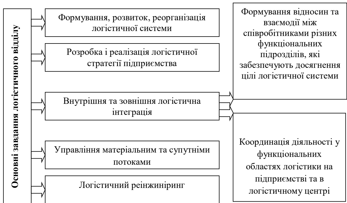
Рис. 1. Завдання логістичного відділу

ефективного розв'язання логістичних завдань необхідно створювати окремий відділ – логістичний (рис. 1).