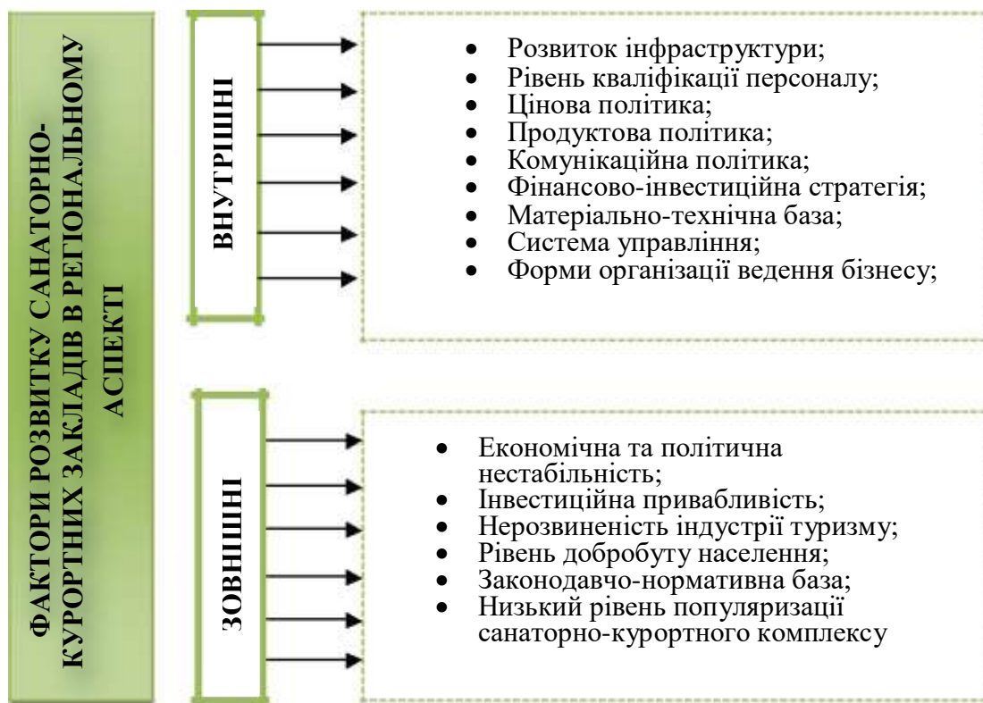
Рис. 2. Фактори розвитку санаторно-курортних закладів України в регіональному аспекті