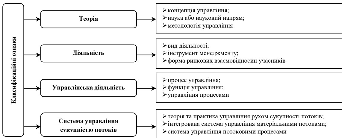
Рис. 1. Систематизація існуючих визначень «логістика» (авторська розробка)

На сучасному етапі концептуальні підходи до визначення змісту поняття «логістика» розробляють багато вітчизняних та зарубіжних учених і фахівців-практиків. Аналіз наукової літератури свідчить, що існує різноманіття визначень терміна «логістика», які базуються на різних наукових позиціях. На даний час у спеціальній літературі з логістики є більше 150 термінів. На основі узагальнення існуючих визначень поняття «логістика», які запропоновано різними авторами, їх систематизовано за класифікаційними ознаками в такі 4 блоки: теорія, діяльність, управлінська діяльність та система управління сукупністю потоків ( рис. 1 ).