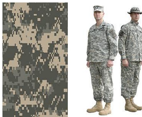
Рис. 1. Приклад використання єдиного шаблону універсального камуфляжу “Скорпіон W2” [9]

Засоби оптичного маскування, що зазвичай перебувають у речовому постачанні військових підрозділів армій світу, здебільшого мають вигляд комбінезонів або костюмів (рис. 1).