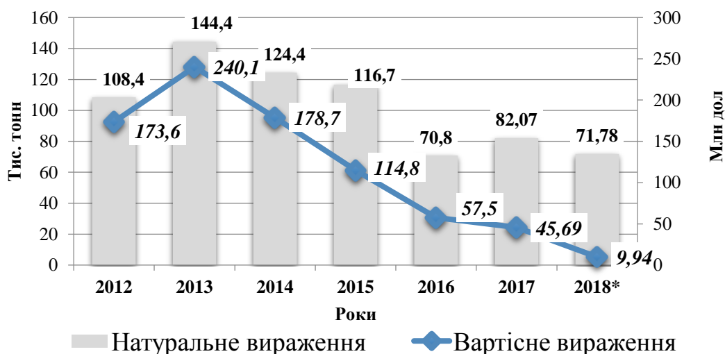
Рис. 2. Динаміка та прогноз обсягу експорту соків у вартісному та натуральному вираженні за період 2012-2018 рр.

Динаміка обсягу імпорту у вартісному та натуральному вираженні має, як і експорт тенденцію до зниження (рис. 3). Так, найбільші обсяги імпорту були у 2012 та 2013 роках.