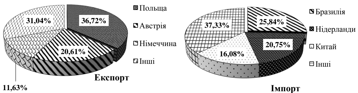
Рис. 4. Частка країн-контрагентів експорту та імпорту соків у 2017 році