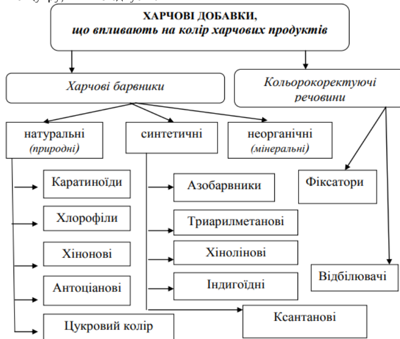
Рис. 2. Класифікація харчових добавок

Для додання крему яскравого жовтого кольору треба взяти моркви, порізати кружальцями товщиною приблизно 5-7 мм, обсмажити до м'якості на вершковому маслі, після чого розім'яти або протерти через ситечко. Отриману масу слід змішати з вершковою олією в співвідношенні один до одного. Після цього барвник придатний для додавання в крем. Також для отримання жовтого кольору можна скористатися соком моркви, розведеним у воді шафраном або порошком куркуми. Якщо змішати морквяний сік з червоним ягідним або буряковим, вийде натуральний помаранчевий барвник. Також цей колір кремів надає сік з натертої на тертці апельсинової цедри.