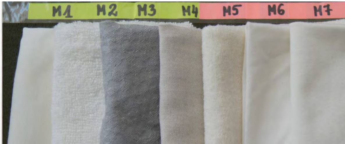
Рис . 1. Зразки досліджуваних текстильних матеріалів