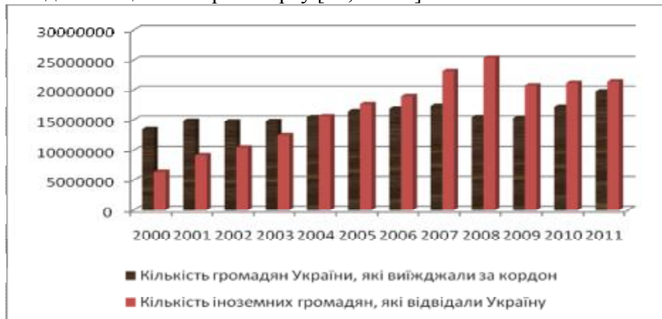
Рис. 1. Поток через кордон українських та іноземних громадян

Показники перетину кордону особами та транспортом, показники міграції, обсяги експорту та імпорту свідчать, що відбувається постійне зростання навантаження на кордон. Близько 17,5 млн. українців щорічно виїжджають за кордон. Постійно зростає кількість іноземців, що відвідують Україну (рис. 1). На 2001 р. побували за кордоном 14,8 млн. громадян України і 9,2 млн. іноземців відвідало Україну. На 2011 р. кількість громадян України, які виїздили за кордон, становила близько 20 млн., а кількість іноземних громадян, які відвідали Україну – 21 млн. [26]. Привертає увагу те, що активність іноземців перевищує активність українців. Про загальмованість мобільності українців говорить і те, що середня відстань перевезень одного пасажирів за окремими видами транспорту загального користування, якщо порівняти з 1985 р., зросла тільки для авіаційного транспорту [27, с. 251].