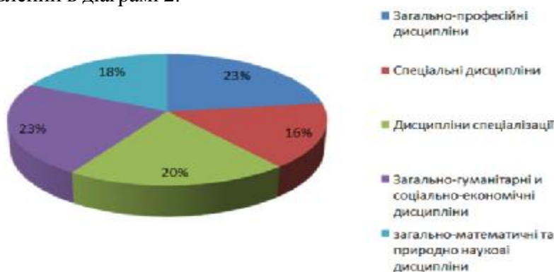
Рис. 2. Розподіл навчального навантаження за циклами дисциплін

Навчальний план підготовки фахівця об'єднує п'ять циклів навчальних дисциплін. Кожен цикл включає дисципліни, обов'язкові для вивчення, а також дисципліни по вибору студента, встановлювані факультетом. Як по окремих циклах, так і в цілому, кредит навчаного часу, що відводиться на вивчення дисциплін, знаходиться в межах, допустимих до стандартів. Розподіл навчального навантаження за циклами дисциплін представлений в діаграмі 2.