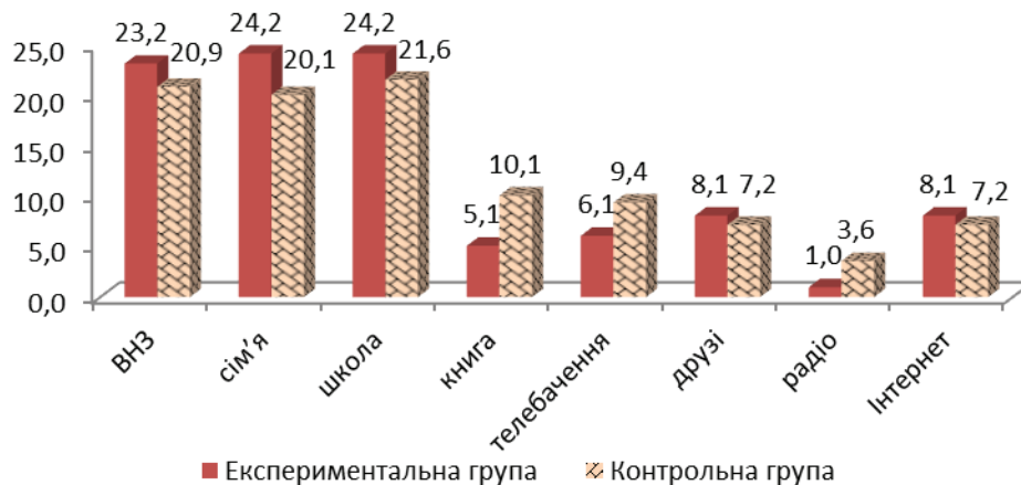
Рис. 1. Джерела інформованості про «толерантність» (%)

За даними рис. 1., констатуємо, що серед запропонованих джерел суттєво переважають навчальні заклади (ВНЗ: ЕГ–23,2% і КГ–20,9% та школа: ЕГ–24,2% і КГ–21,6%) та сім'я (ЕГ–24,2% і КГ–20,1%), що в свою чергу обумовлює значимість цих соціальних інститутів для молоді.