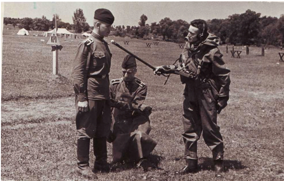
Фото 3. На практичних заняттях по санітарно-хімічному захисту. 1956 р.

КВМУ було переведене в середині 1954 року у військове містечко на вул. Коноплянській (Куренівка). Навчальний корпус було обладнано в напівкруглому приміщенні Північної напівбашти Госпітального укріплення на вул. Госпітальній [12]. У цьому приміщенні до 1926 року розташовувалась Військово-фельдшерська школа [13]. У результаті такого переміщення училище було відірвано від клінічних та навчально-практичних баз, які розташовувались в центральній частині міста. Після виділення училищу двох автобусів, для доставки курсантів до місць занять та до училища ситуація з навчальним процесом трохи покращилась. Однак, командування училища вирішило питання про переведення навчального закладу ближче до клінічних навчально-лікувальних баз. В серпні 1955 року училище було переведено до військового містечка на вул. Московській, 22. На цій території воно розташовувалось до моменту переформування у Київське республіканське медичне училище.