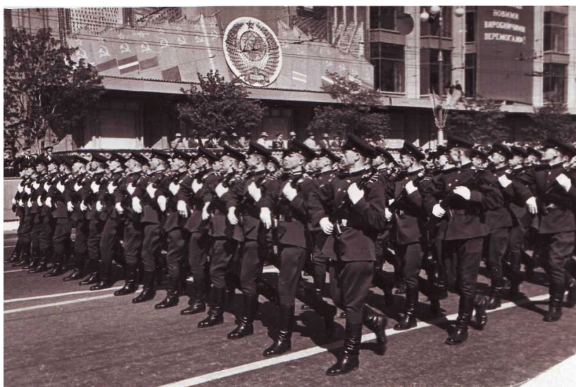
Фото 4. Курсанти КВМУ учасники параду військ Київського гарнізону, травень 1957 р.

Щорічно випускники КВМУ, яких з кожним роком залишається все менше і менше