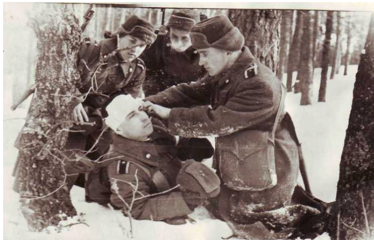
Фото 2. Під час практичних занять по наданню першої допомоги

Крім основного контингенту курсантів, в училищі у 1943-1944 роках була організована школа підготовки санінструкторів з двох-трьох місячним терміном навчання. До школи зараховувались солдати і сержанти, які служили у військах на посадах санітарів та проходили в госпіталях і лікарнях Уральського військового округу курс лікування після отримання на фронті поранень та контузій і визнаних військово-лікарською комісією придатними до військової служби.